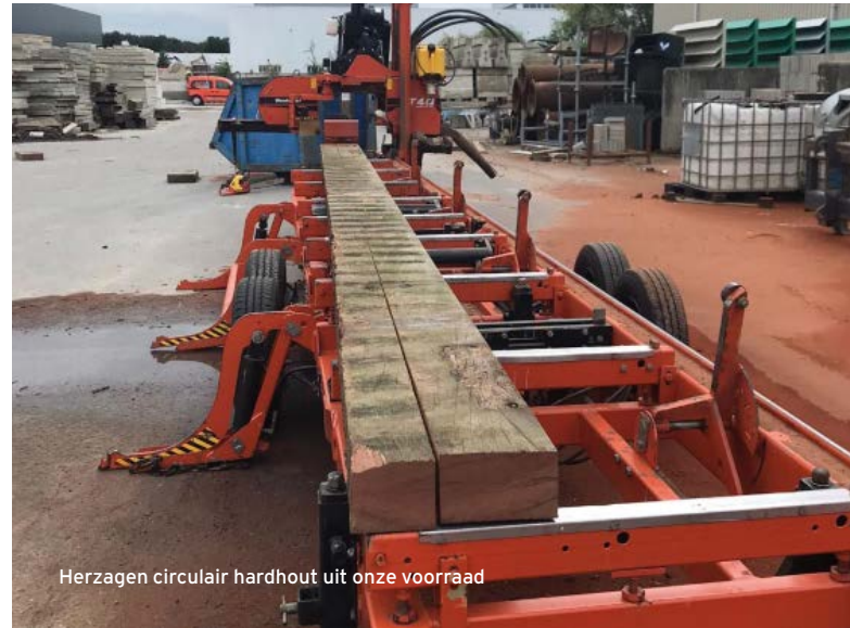
Herzagen circulair hardhout uit onze voorraad

Knipscheer Infrastructuur beschikt over veel gebruikt hardhout met grote afmetingen, wat zorgt voor een snelle levering in de gewenste formaten. Dankzij onze ervaring in het herge-