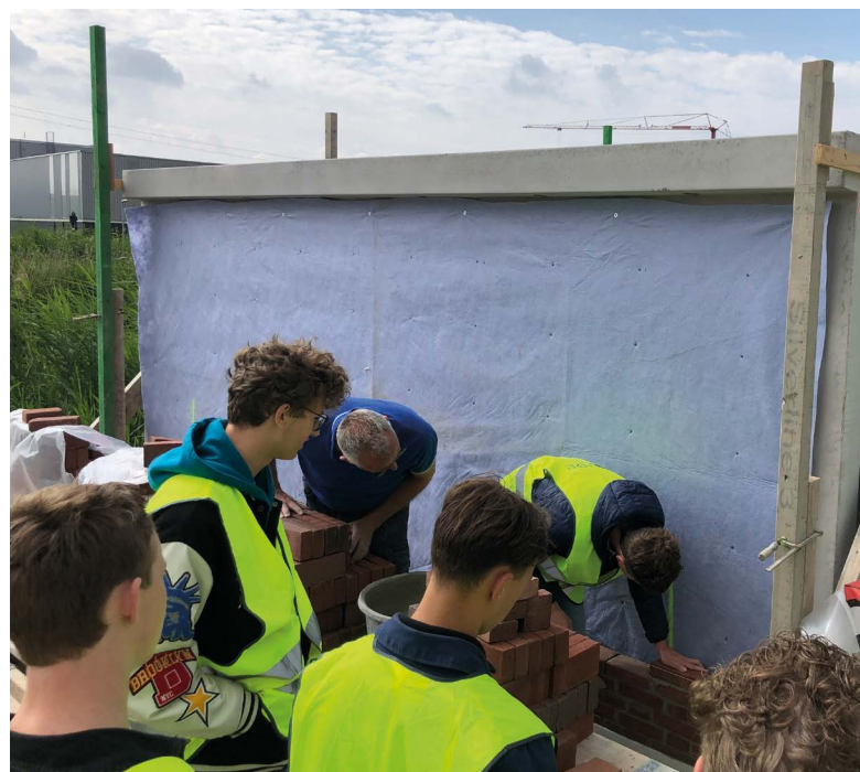
Samenwerking met leerlingen van Aeres MBO, Almere

Enkele maatregelen met grote positieve impact op de omgeving en CO2-reductie omvatten het gebruik van het IFD-principe (Industrieel, Flexibel en Demontabel) en een prefab bouwmethode die we ontwikkelden voor de bruggen. De bruggen bestaan uit standaard prefab betonelementen die ter plekke aan elkaar worden verbonden. Deze verbindingen, ook wel 'natte knopen' genoemd, kunnen in de toekomst eenvoudig worden verwijderd door hydrodemolition (een techniek waarbij waterkracht wordt gebruikt om constructies te slopen). De prefab elementen zijn daardoor herbruikbaar voor andere toepassingen. Dankzij deze prefab methode reduceerden we