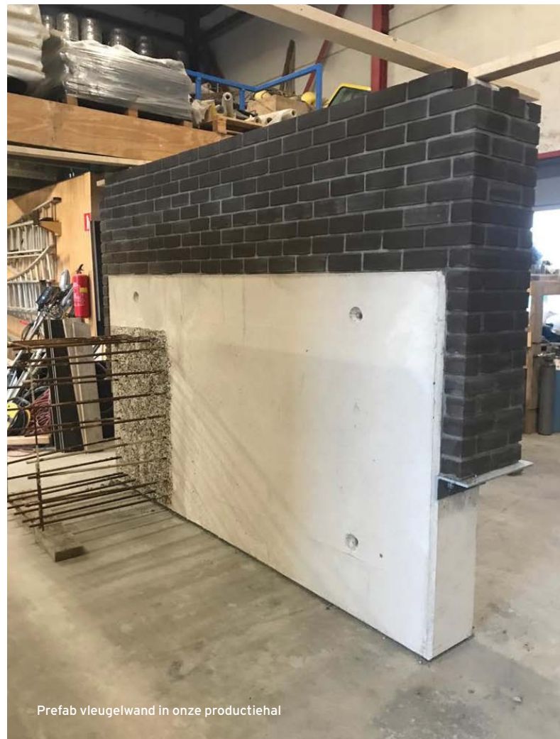
Prefab vleugelwand in onze productiehal

Leerlingen van het Aeres MBO Almere hebben een deel van de kademuur en oever geadopteerd. Samen met Knipscheer Infrastructuur maken zij het ontwerp en verzorgen zij de beplanting van dit deel van de kademuur en oever.