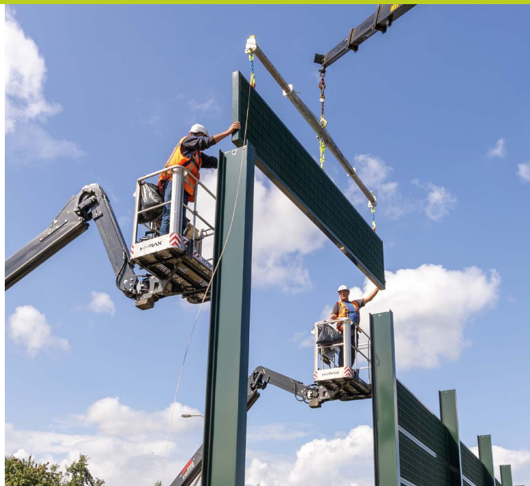
Geluidsschermpanelen op hun plaats gebracht met elektrische hoogwerkers, woonwijk Groenpoort

Werken in schone lucht, met emissieloos materieel, wordt beloofd