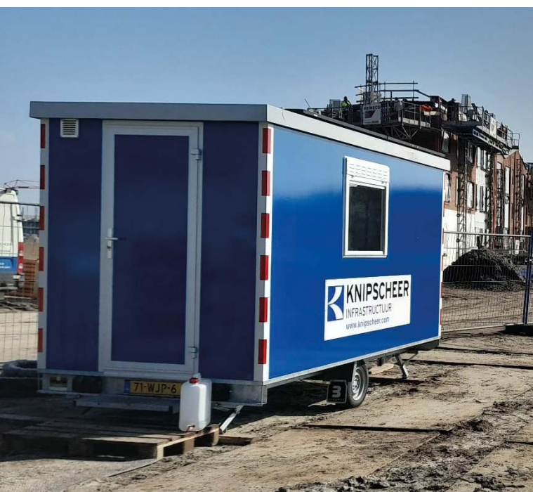
Bouwkeet op zonnepanelen, Almere