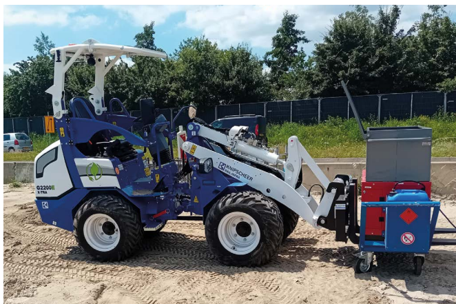
Inzet elektrische minishovel G2200E bij o.a. laswerkzaamheden

De Rondweg-Oost bij Veenendaal is een druk punt voor het verkeer op de N233. Dit zorgt voor vertragingen, vermindert de bereikbaarheid en verhoogt de verkeersveiligheid. Door de aanleg van een nieuwe woonwijk, Groenpoort, zal het verkeer verder toenemen. De Provincie Utrecht besloot om de N233 Rondweg-Oost te verbreden en een nieuwe aansluiting te maken naar de woonwijk. Ook moesten er geluidsschermen worden geplaatst van ongeveer 2 kilometer lang en 6 meter hoog. Sommige van deze schermen krijgen zonnepanelen. De Provincie zocht een partner die het project met zo min mogelijk uitstoot van schadelijke stoffen wilde uitvoeren. Hoofdaannemer Van Gelder vroeg Knipscheer Rail-Infra in de aanbestedingsfase om mee te denken over het ontwerpen en plaatsen van de geluidsschermen, en om te helpen met het integreren van zonnepanelen.